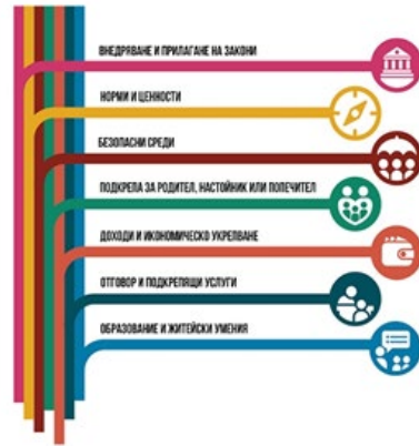
Фиг. 1. Седем стратегии за прекратяване насилието над деца

Внимание заслужава разглеждането на всяка една от стратегиите: