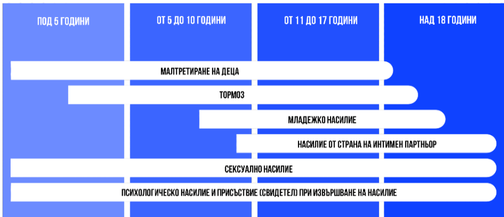
Фиг. 1 Видове насилие според възрастта на засегнатите в качеството на потърпевши

Глобални оценки показват, че един милиард деца – над половината от всички деца на възраст от 2 до 17 години – са преживели физическо, сексуално или психологическо насилие само през последните 12 месеца. Ключов фактор, който прави децата и юношите, особено момичетата, уязвими към насилие (и увеличава вероятността момчетата и мъжете да извършват такова насилие) е социалната толерантност както към виктимизация на момичета, така и към авторство на актовете на насилие от страна на момчета и мъже. Често тази злоупотреба или експлоатация се възприемат като нормални и извън контрола на общностите, което, наред със срама, страха и убеждението на преживелите насилие, че никой не може да им помогне, води до ниски нива на съобщаване (докладване) пред компетентните органи. Не е за подценяване и фактът, че пострадалите често се самообвиняват за насилието, което преживяват.